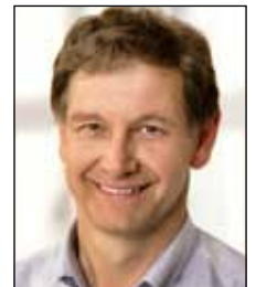
Hubert Ulrich, MdL Fraktionsvorsitzender

Derzeit laufen die Auswertungen des Stresstests der französischen Atomkraftwerke. Klar ist bereits, dass alle 58 französischen AKW nachgerüstet werden müssen. Der Stresstestbeauftragte für das Saarland, Rheinland-Pfalz und Luxemburg, Dieter Majer, hat inzwischen seinen Bericht über den Stresstest für das AKW Cattenom vorgelegt.