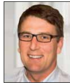
Markus Schmitt, Landtagsabgeordneter

Alle Änderungen wurden von den drei Koalitionsfraktionen einstimmig beschlossen. Die Vorgaben der Schuldenbremse können auch 2012 - wie bereits 2011 - eingehalten werden.